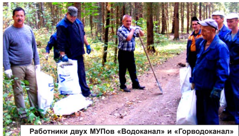
Работники двух МУПов «Водоканал» и «Горводоканал» расчищают от многолетнего мусора пешеходную дорожку от улицы Ольховской до литейно-прокатного завода